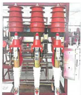
Figura N.º 1 Seccionador bajo carga con base porta fusible

La celda de protección será equipada con barras de cobre mínimamente de dimensiones 5x50mm según plano que permitirá la conexión entre la celda de remonte y la celda de protección en media tensión según lo mostrado en plano de detalle (Fig.1), a su vez esta celda permitirá la conexión de los cables de media tensión por la parte inferior con el transformador.