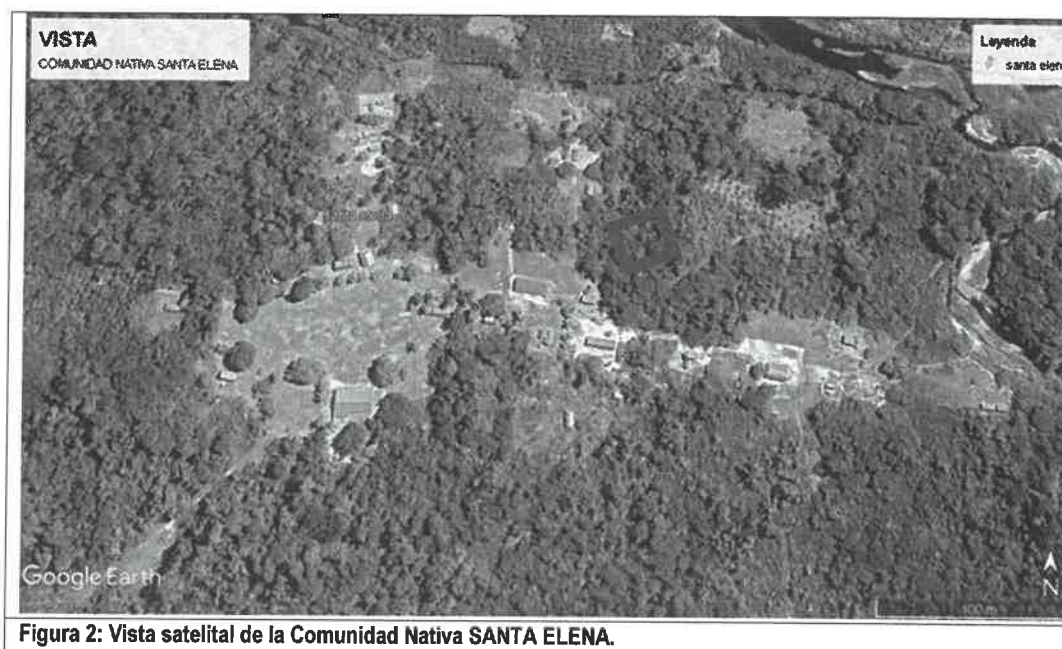
Figura 2: Vista satelital de la Comunidad Nativa SANTA ELENA.