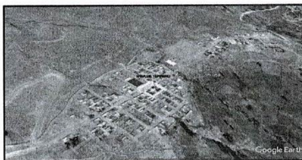
Figura 1: Esquema de Micro Localización

La obra Creación del Servicio de atención Comunal a las Actividades Sociales y Económicas en el Centro Poblado Nueva Camilaca del Distrito de Camilaca se encuentra ubicado: