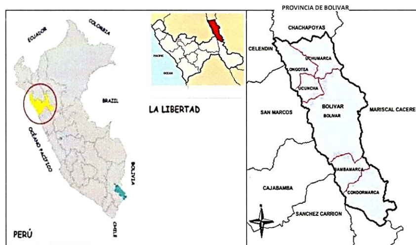
IMAGEN N°01: MACRO-LOCALIZACIÓN DEL PIP.

El distrito de UCUNCHA se encuentran a una altura de 2,603.86 m.s.n.m. respectivamente. Presenta una topografía entre llana y ondulada