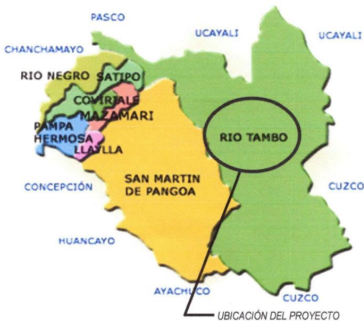
GRAFICO N° 03