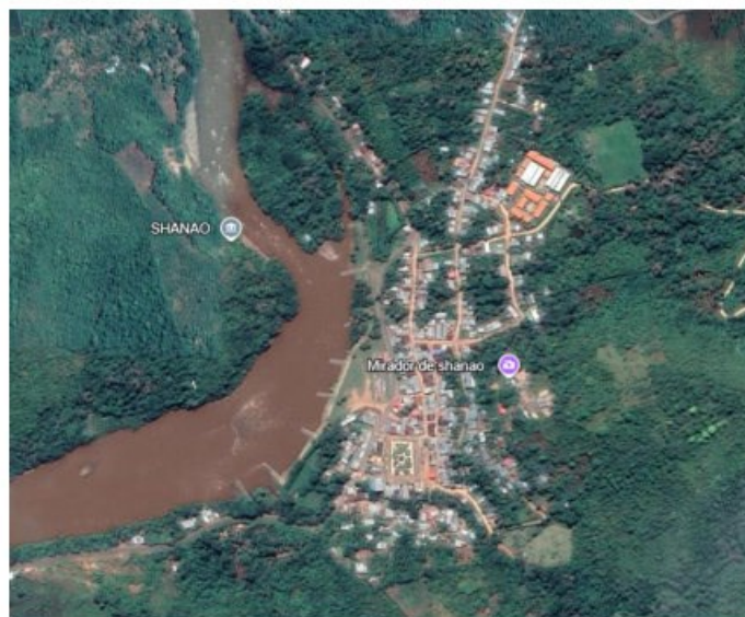
Ilustración N° 1: Vía de acceso al Proyecto (Tarapoto – Shanao)

"AÑO DE LA RECUPERACIÓN Y CONSOLIDACIÓN DE LA ECONOMÍA PERUANA"