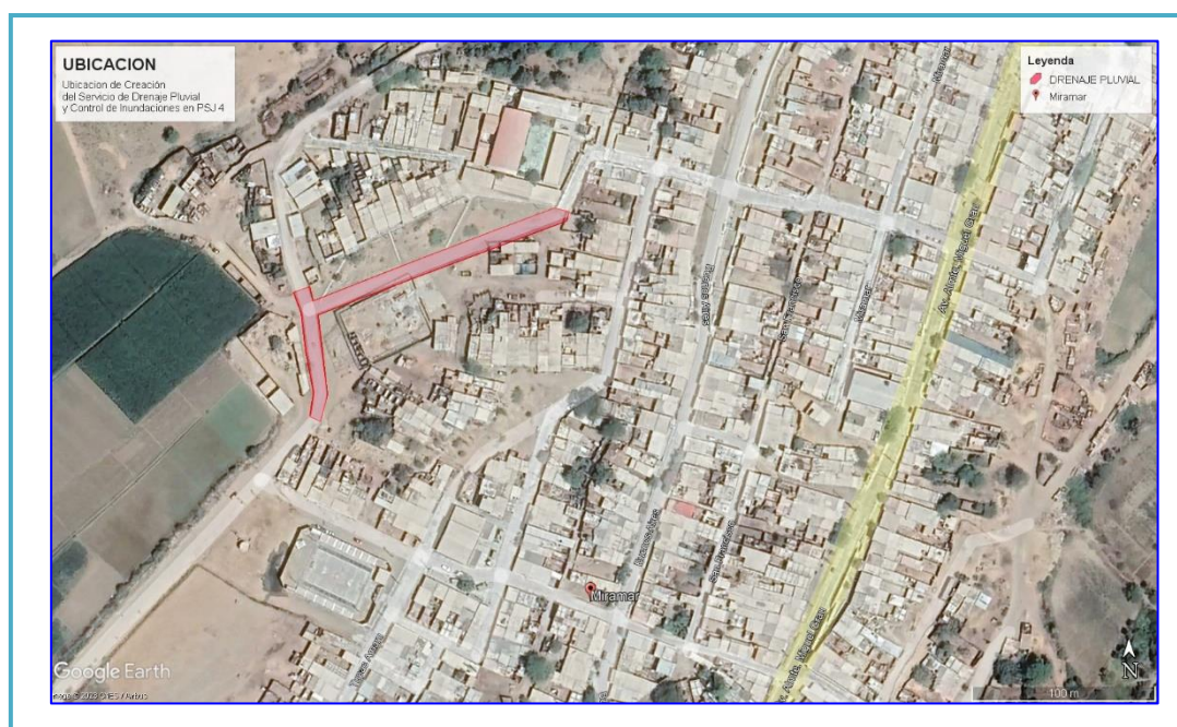
Gráfico 02: Localización del proyecto Elaboración propia