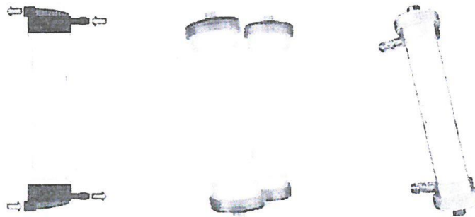
Fig. 1.: Dializador para Hemodiálisis de Bajo Flujo de Membrana Sintética (No implica diseño)