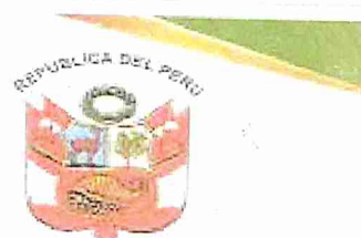
Imagen 01-03: Localización