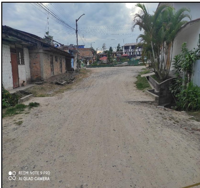
Jr. Ricardo Palma C 09 – El sistema de drenaje es deficiente y no cumple con la función correctamente.