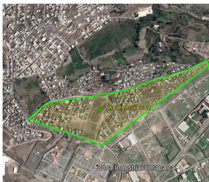
Ilustración 1: Área de intervención del Proyecto (Elaboración propia) Google Earth.

Región : Arequipa. Provincia : Arequipa. Distrito : Sabandía. Sector : Umapalca.