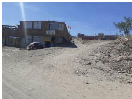
ESQUINA PASAJE 12 CON VIA PAISAJISTA