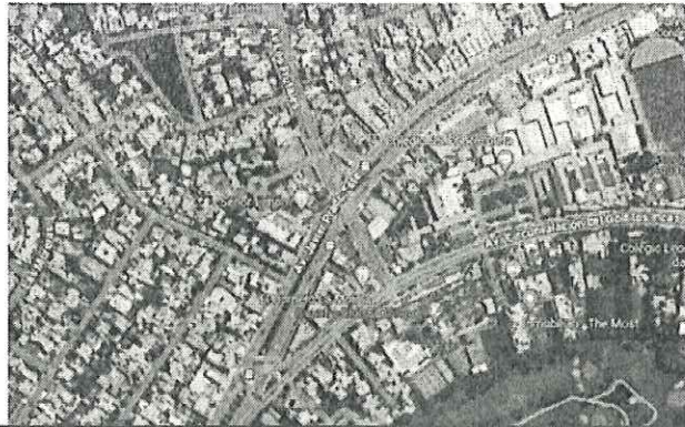
Figura N° 1. Ubicación de Idea del Proyecto

PASO A DESNIVEL 1: INTERSECCIÓN DE AV. CIRCUNVALACIÓN DEL GOLF DE LOS INCAS Y AV. LOS FRUTALES