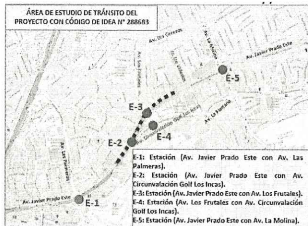
Figura N° 4. Ubicación de estaciones de conteo de tráfico y peatonal

Calipe CARLOS FELIX RODRIGUEZ CAYAC INGENIERO DE TRANSPORTES Reg. CIP N° 100707