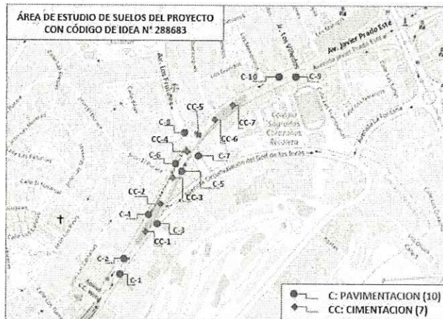
Figura N° 5. Ubicación de calicatas con fines de pavimentación y cimentación

INVERMET FONDO METROPOLITANO DE INVERSIONES