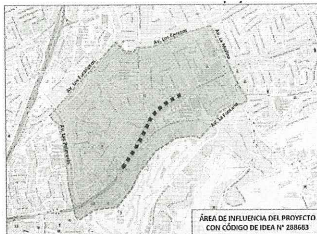
Figura N° 2. Área de influencia del proyecto

Calipe CARLOS FELIPE RODRIGUEZ CHANCE INGENIERO DE TRANSPORTES Rég. CIP N° 189707