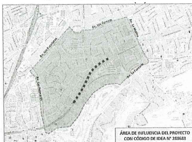
Figura N° 6. Área de influencia del proyecto

Preliminarmente, se proyecta UN paso a desnivel que cruza por la intersección de la Av. Los Frutales hasta la Av. Golf Los Incas, el cual se deberá sustentar los estudios técnicos pertinentes como son los estudios básicos de ingeniería.