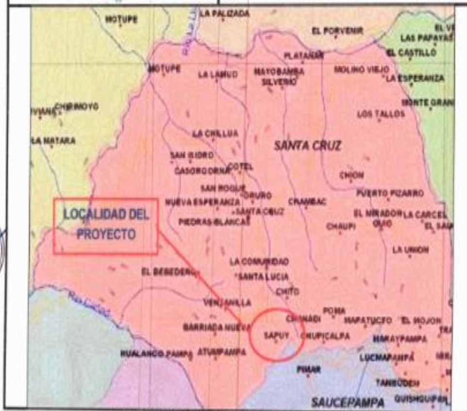
MAPA DE UBICACIÓN DEL PROYECTO.