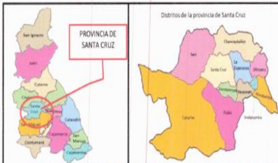
MAPA DE SANTA CRUZ.