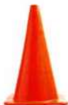
CONO DE SEGURIDAD