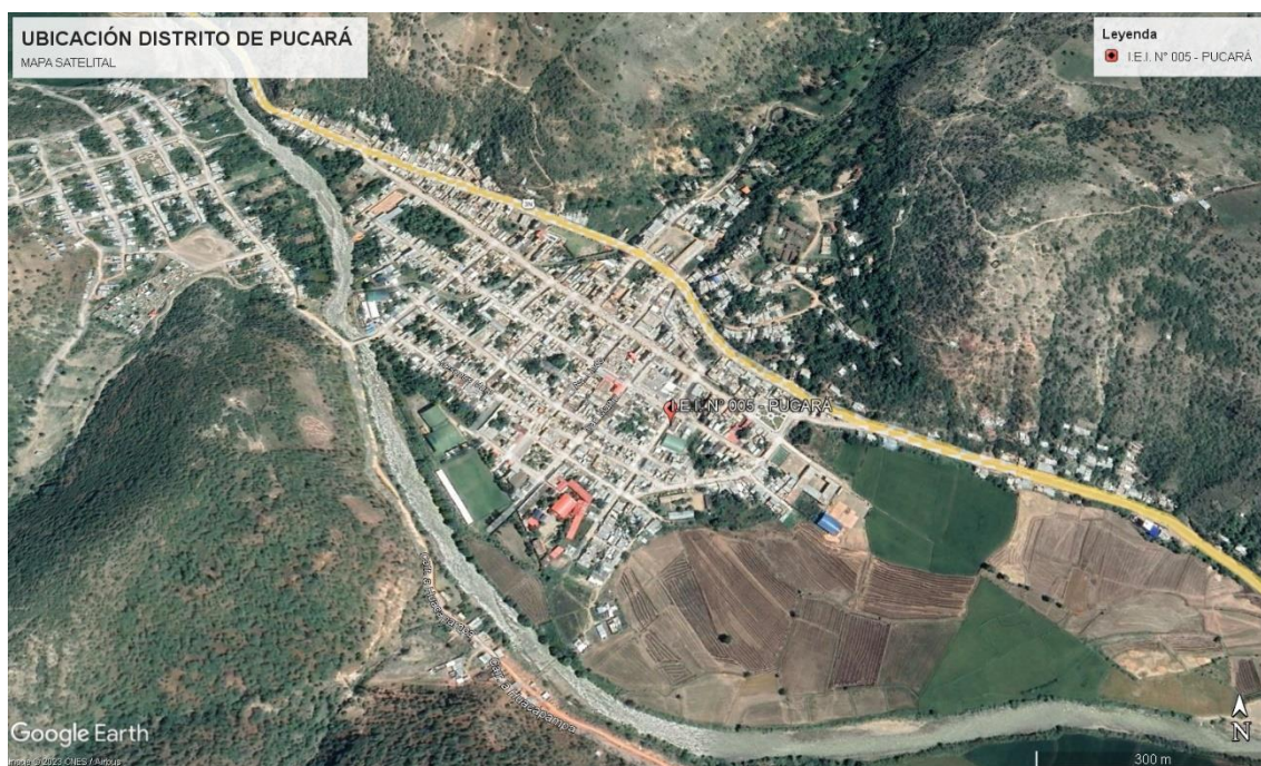
IMAGEN 01: UBICACION DEL PROYECTO

Ubicación de la Losa Deportiva, cuyas coordenadas UTM, WGS84: