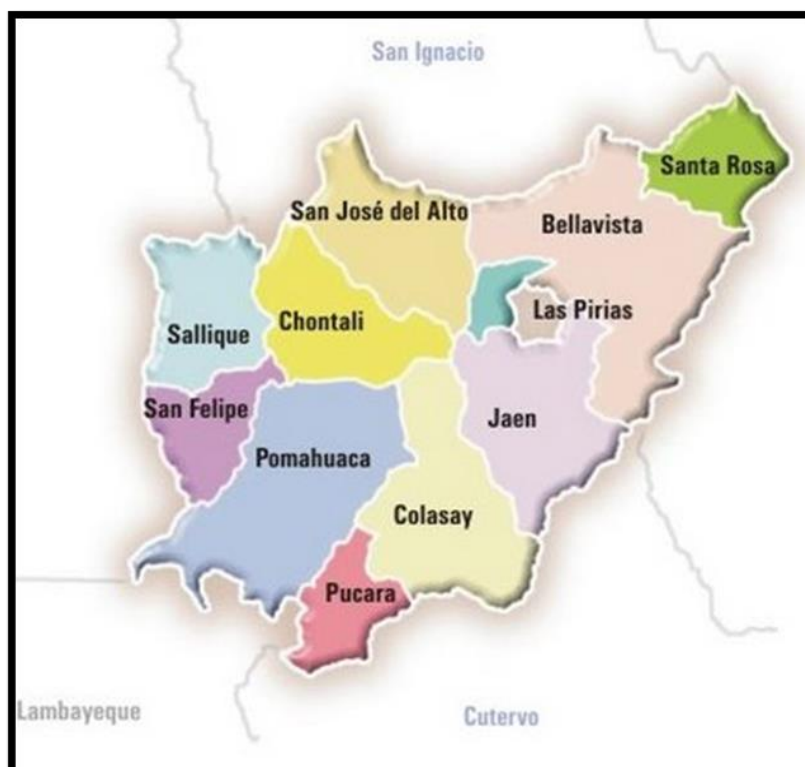
UBICACION EN LA PROVINCIA DE JAEN