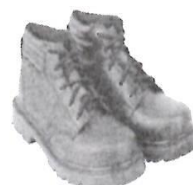
Zapatos de Seguridad con Puntera de Acero