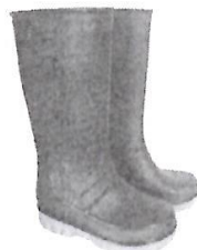
Botas de Jefe