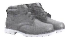
Botines cortos de Jebe