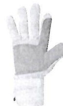
Guantes de Seguridad de Obra