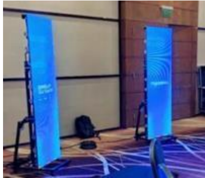
*Imagen referencial de totem