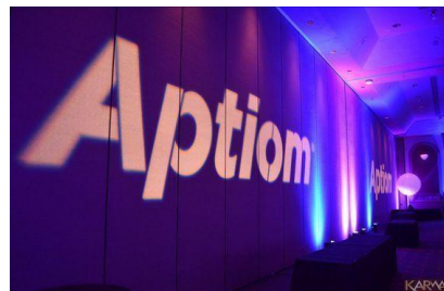
*Imagen referencial de gobos y tachos par led.