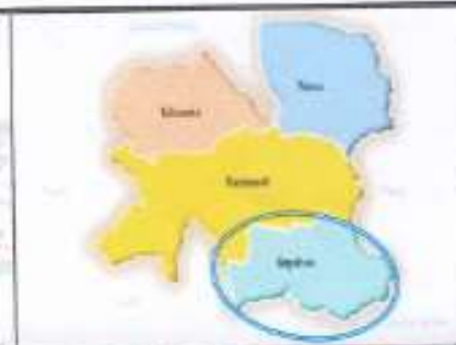
DISTRITO DE SEPAHUA