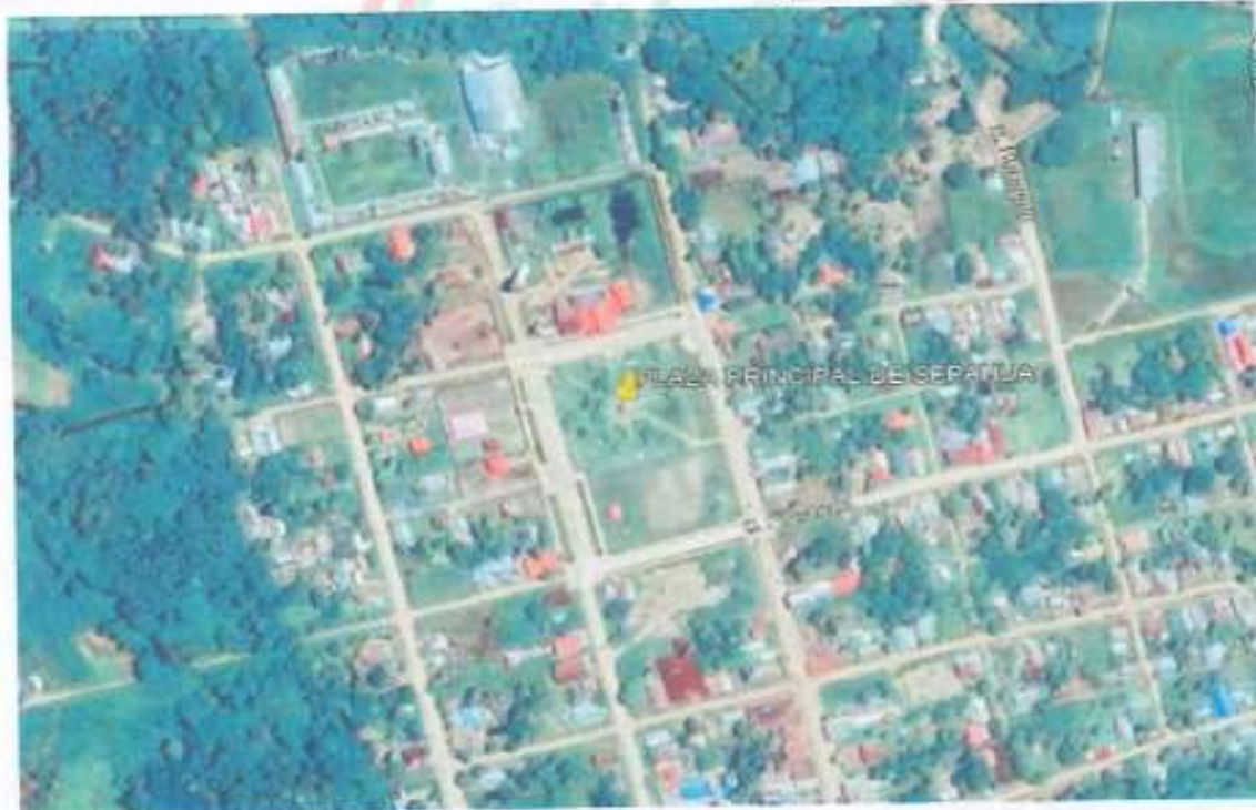
PLAZA MAYOR - VILLA SEPAHUA