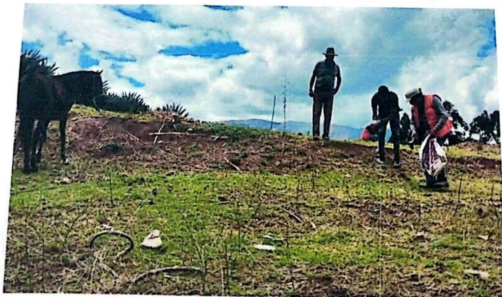
Imagen N°02: Constatación de las dimensiones, con el propietario e hijos.