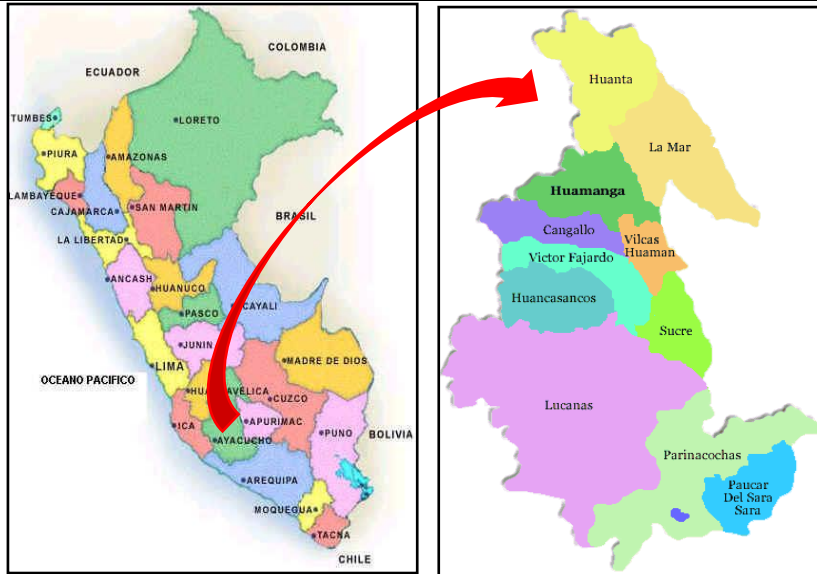
PROVINCIA DE HUANTA.