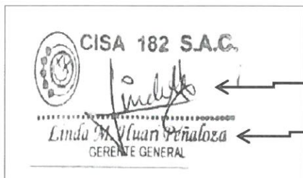
CERTIFICADO DE CAPACITACION A FOLIO 79