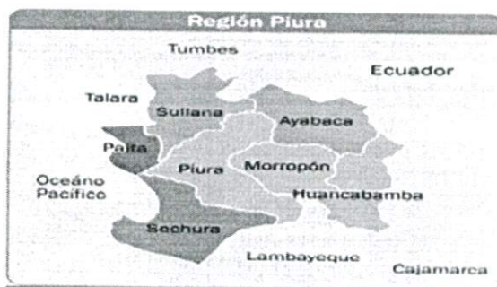
Imagen N° 01

Piura es una provincia del noroeste del Perú situada en la parte central del Departamento de Piura, Limita con la Provincia de Paita y de Sullana al Noroeste, con las de Ayabaca, Morropón y Lambayeque por el este, y con la Sechura por el suroeste. Su capital es la ciudad de Piura.