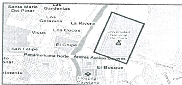
Imagen N° 02

La Universidad Nacional de Piura está ubicada en al Urb. Miraflores S/N, Castilla Piura 295.