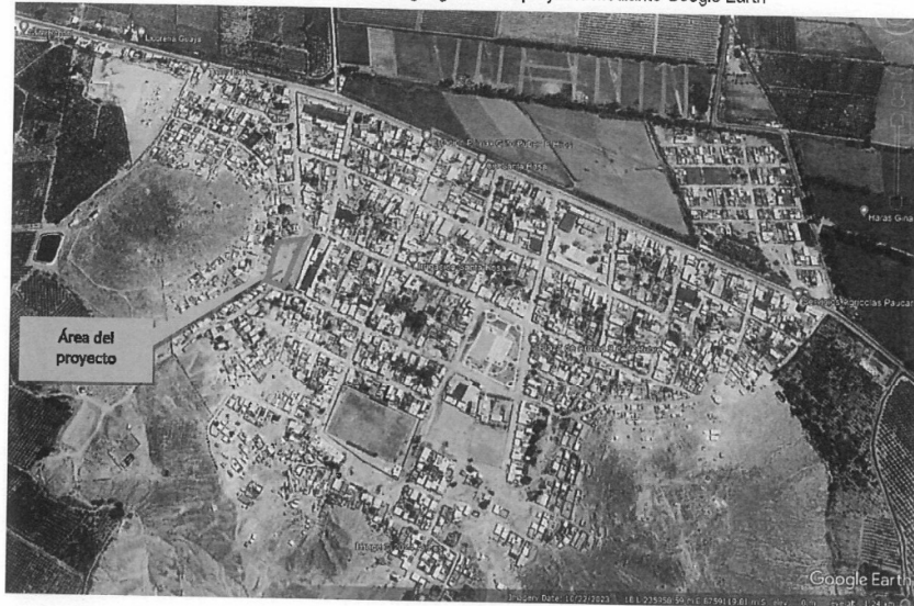
GRÁFICO 2: Ubicación geográfica del proyecto mediante Google Earth

El Distrito de Sayán tiene como objetivo principal promover el desarrollo integral y sostenible del distrito, fomentando la inversión pública y privada, el empleo y garantizando la igualdad de oportunidades y el ejercicio pleno de los derechos de sus habitantes, en consonancia con los planes y programas de desarrollo nacionales, regionales y locales. En línea con este enfoque, se ha considerado necesario realizar los estudios necesarios para la construcción del campo de mini fútbol con grass sintético; con área de fútbol, vóley y básquet; con cerco tipo UNI, Cobertura metálica, etc.; con el fin de proporcionar a la población del CP Nueve de Octubre; del Distrito de Sayán y sus alrededores condiciones eficientes para una infraestructura deportiva adecuada.