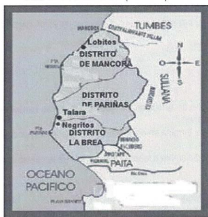
GRÁFICO N° 03 TALARA: LOCALIZACION GEOGRAFICA DE LAS AV. SALAVERRY (MZ D Y G)