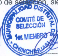
1er. Miembro Comité.