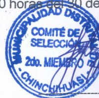
2do. Miembro Comité