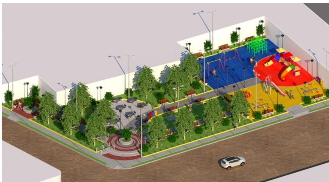
Figura N° 7: Vista General del Parque Infantil

El proyecto contempla la construcción de áreas de juegos infantiles con piso de gras sintético de colores, en donde se instalara 01 columpio, 01 sube y baja, 01 tobogán, 01 cubo y 01 castillo, así mismo, un área de juegos lúdicos, una zona de juegos con resortes infantiles, y un gimnasio al aire libre; en el recorrido del parque se contará con 02 jardineras centrales de concreto ubicadas en las entradas del proyecto, con pisos de adoquín, bancas de madera y fierro fundido, luminarias ornamentales y basureros; y por último se instalará Grass natural y diferentes tipos de arborización.