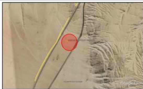
Ubicación propuesta para el campamento peaje lomas Ilo.

REFERENCIA: 9.28 KM DESPUES DEL PEAJE DE ILO, UNTIMA CURVA ANTES DE LLEGAR A ILO, DESPUES A LA IZQUIERDA CON TROCHA CARROZABLE DE 560 MT.