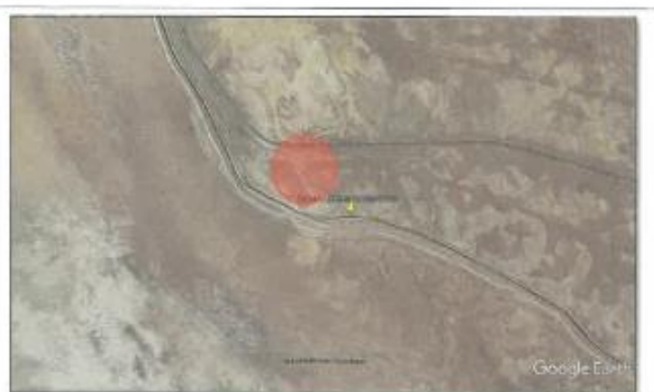
Ubicación propuesta para el campamento Lomas carretera interoceánica.

Referencia : 9.28 KM DESPUES DEL PEAJE DE ILO, UNTIMA CURVA ANTES DE LLEGAR A ILO, DESPUES A LA IZQUIERDA CON TROCHA CARROZABLE DE 560 MT.