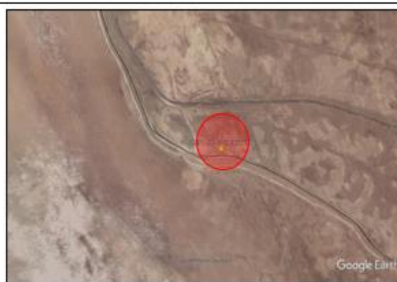
Ubicación propuesta para el campamento Lomas carretera interoceánica.

REFERENCIA: CARRETERA PANAMERICANA SUR SEGUNDO DESVIO A ILO A 56.9 KM DE MOQUEGUA EN DIRECCIÓN A LA CIUDAD DE TACNA.