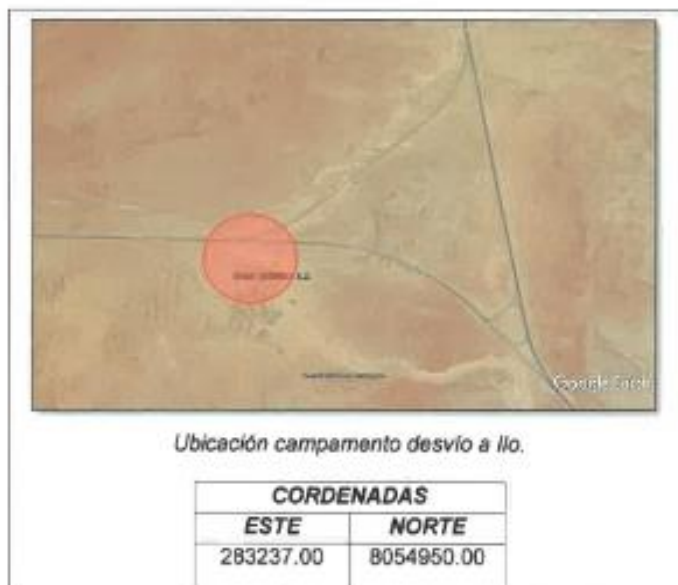
Ubicación campamento desvío a Ilo.

Referencia : CARRETERA PANAMERICANA SUR SEGUNDO DESVÍO A ILO A 56.9 KM DE MOQUEGUA EN DIRECCIÓN A LA CIUDAD DE TACNA