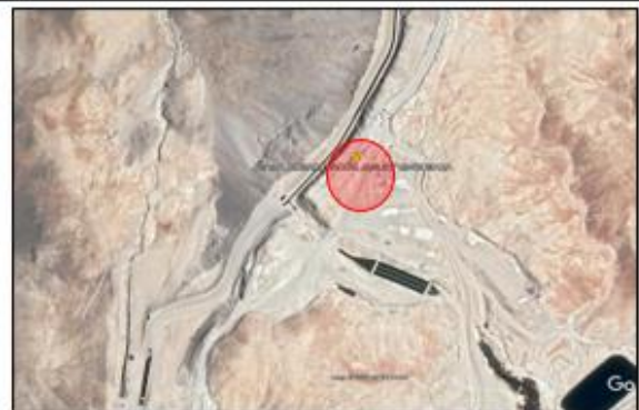
Ubicación campamento desarenador Jaguay Rinconada

REFERENCIA: DESVIO POR YACANGO TROCHA CARROZABLE 8.57 KM.