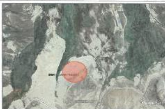
Ubicación campamento de vigilancia Chilota – Chincune

Referencia : Carretera Moquegua - puno pasando cruce de carretera Desaguadero a 11 km vía asfaltada, desvío derecha trocha carrozable 7.4 km, pasando el inicio de túnel Jachacuesta a 600 mt.