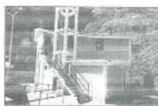
UBICACIÓN CAMPAMENTO OTORÁ