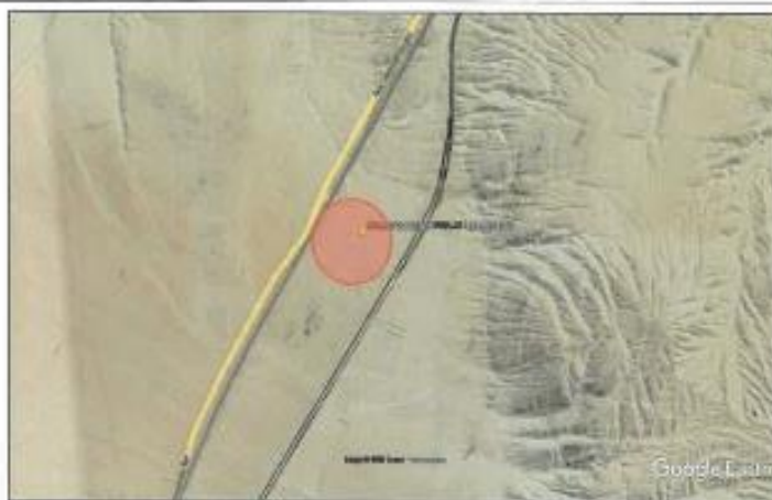
Ubicación propuesta para el campamento peaje lomas Ilo.

Región : Moquegua Provincia : Ilo Distrito : Ilo Sector : Peaje Lomas de Ilo Referencia : SE ENCUENTRA A 2.33 KM ANTES DE LLEGAR A PEAJE DE ILO, LADO IZQUIERDO DESVIO DE TROCHA CARROZABLE A 50 MT.