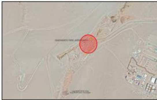
Ubicación campamento Túnel Jachacuesta – Chilota