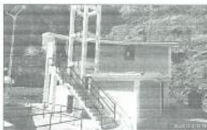
UBICACIÓN CAMPAMENTO OTORA