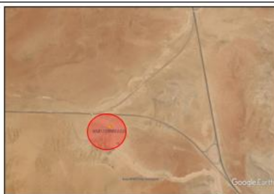
Ubicación propuesta para el campamento Desvío a Ilo