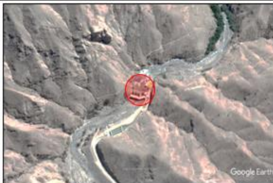
Ubicación campamento Otor

REFERENCIA: CARRETERA MOQUEGUA - PUNO PASANDO CRUSE DE CARRETERA DESAGUADERO A 11 KM VIA ASFALTADA, DESVIO DERECHA TROCHA CARROZABLE 7.4 KM. PASANDO EL INICIO DE TUNEL JACHACUESTA A 600 MT