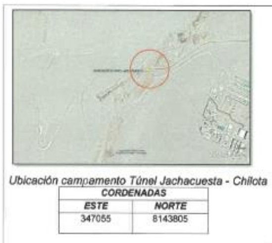
Ubicación campamento Túnel Jachacuesta - Chilota

Referencia : Carretera Moquegua - puno pasando cruce de carretera Desaguadero a 11 km vía asfaltada, desvío derecha trocha carrozable 7.4 km. pasando el inicio de túnel Jachacuesta a 14 km.