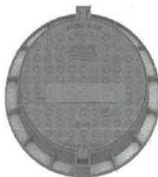
Peso Total Marco y Tapa 62.3 Kg