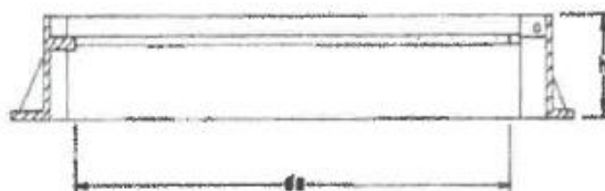
Peso Marco 26.1 Kg