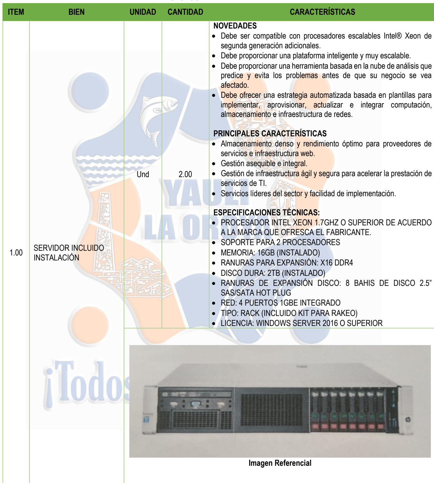
CUADRO N°01: CARACTERÍSTICAS DE EQUIPOS TECNOLÓGICOS Y SERVIDOR INTEGRAL DE TECNOLOGÍA AVANZADA