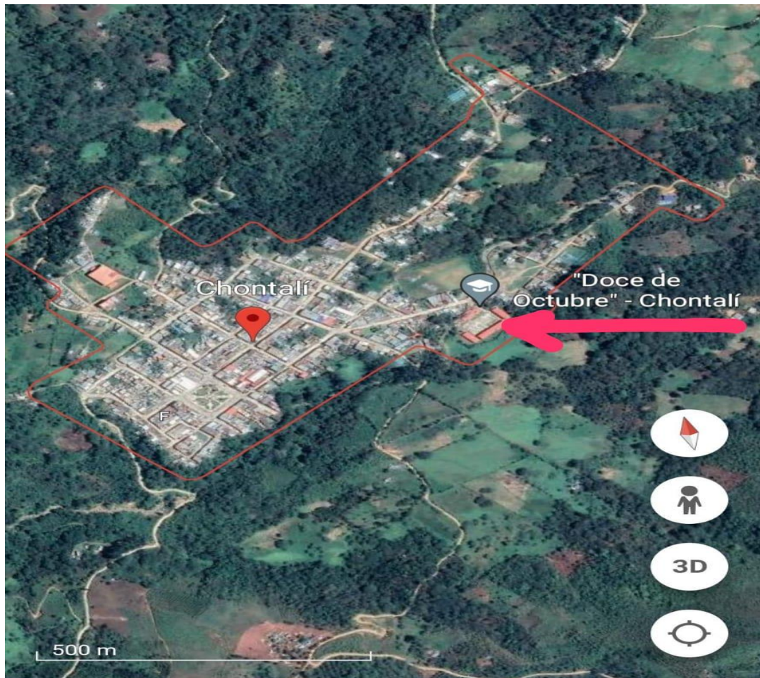
IMAGEN 01: UBICACION DEL PROYECTO