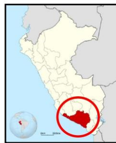
Figura N° 2,3 y 4 – Ubicación Geográfica Nacional