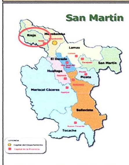
DEPARTAMENTO DE SAN MARTIN CON LA PROVINCIA DE RIOJA.