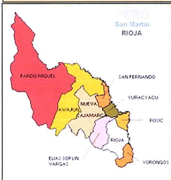
MAPA DE LA PROVINCIA DE RIOJA CON EL DISTRITO DE PARDO MIGUEL