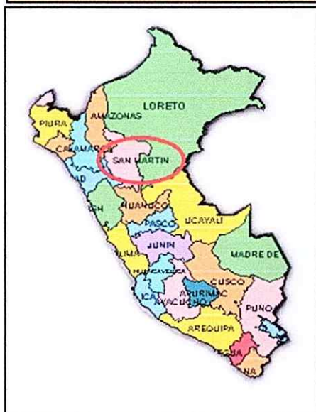
MAPA DEL PERÚ MOSTRANDO EL DEPARTAMENTO DE SAN MARTIN