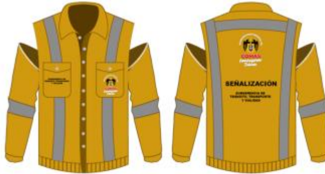
IMAGEN REFERENCIAL: SEÑALIZACIÓN