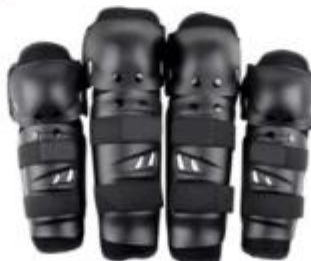
IMAGEN REFERENCIAL: SERENAZGO