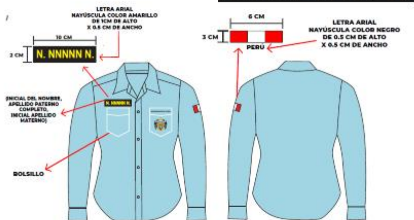
IMAGEN REFERENCIAL: SERENAZGO (MUJER)