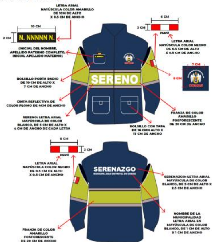
IMAGEN REFERENCIAL: SERENAZGO