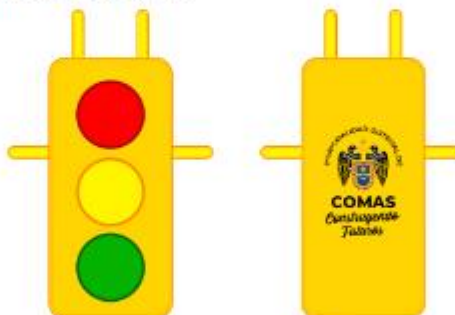
IMAGEN REFERENCIAL: SEGURIDAD VIAL

Palacio Municipal: Plaza de Armas s/n Av. España cdra. La Libertad km. 11 Av. Túpac Amaru Centro Cívico Municipal: Av. 22 de Agosto cdra. 8 Urb. Santa Luzmila www.municomas.gob.pe