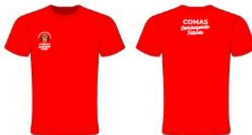
IMAGEN REFERENCIAL: SEGURIDAD VIAL (COLOR ROJO)

Palacio Municipal: Plaza de Armas s/n Av. España cdra. La Libertad km. 11 Av. Túpac Amaru Centro Cívico Municipal: Av. 22 de Agosto cdra. 8 Urb. Santa Luzmila www.municomas.gob.pe