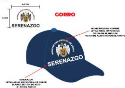
IMAGEN REFERENCIAL: SUB GERENCIA DE SERENAZGO