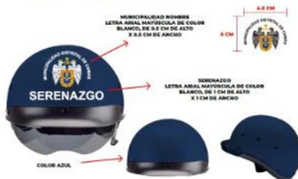
IMAGEN REFERENCIAL: SERENAZGO