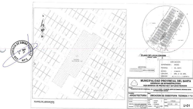
Fig. N°02: Plano de Ubicación del Proyecto.