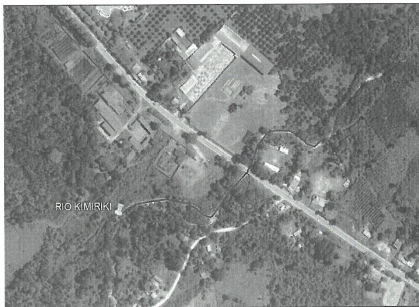
CROQUIS DEL TRAMO A INTERVENIR

Región : Junín Provincia : Chanchamayo Distrito : Pichanaqui. Localidad : RIO KIMIRIKI EN LA LOCALIDAD DE BAJO KIMIRIKI