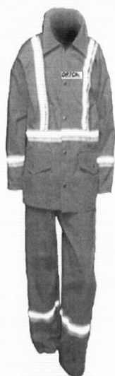
Uniforme de Mantenimiento