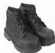
Zapatos de Seguridad con Puntera de Acero