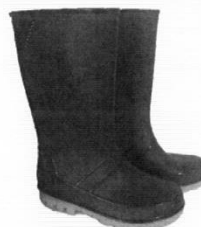
Botas de Jebe