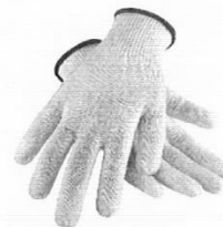
Guantes de Seguridad de Obra