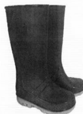
Botas de Jebe