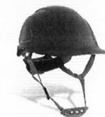
Casco de Seguridad