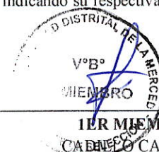
1ER MIEMBRO TITULAR CAMACHO GREYSI YUVITZA