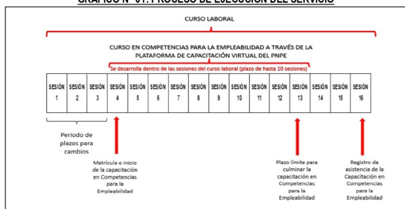
GRÁFICO N° 01: PROCESO DE EJECUCIÓN DEL SERVICIO

El beneficiario tendrá hasta la décima sesión de realizada la matrícula, para culminar el curso en competencias para la empleabilidad y Taller OPE, en la Plataforma de Capacitación Virtual del PNPE (Conforme se detalla en el gráfico anterior). El Proveedor deberá asegurar, a través del Asistente Académico, que el beneficiario culmine la capacitación en competencias para la empleabilidad y taller OPE, debiendo reportar sus resultados, en el segundo entregable. Los módulos para esta capacitación, son los siguientes: