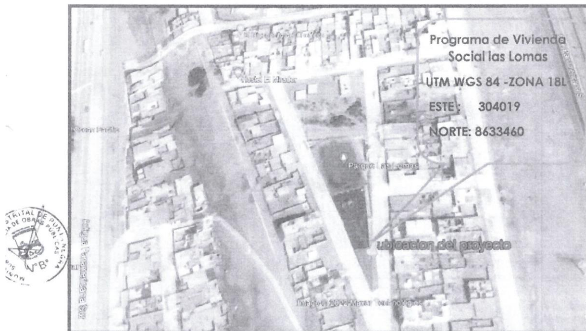
Figura N° 2: Vista satelital del proyecto