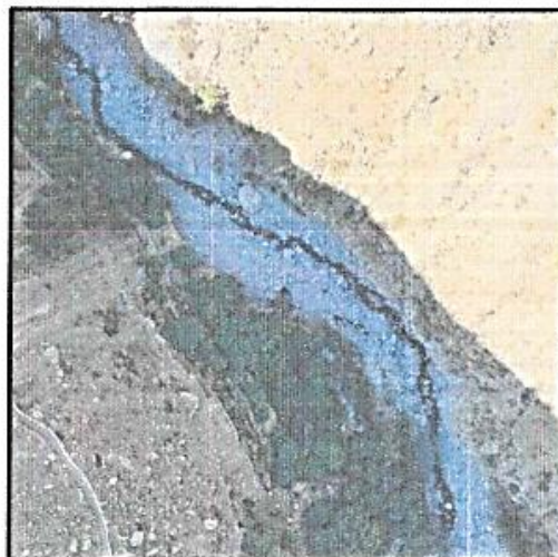
Fuente: IMAGEN SATELITAL DE LA ZONA

Región : Tacna. Provincia : Jorge Basadre. Distrito : Ilabaya. Sector : RÍO HIGUERANI