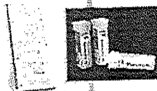
Fig. 1. Agente esterilizante con peróxido de hidrógeno 50% - 55%. No incluye dibujo

Permite la esterilización de material termolabile, que no soporta altas temperaturas ni humedad, como dispositivos médicos reusables, las con ligeros pedimentos, dispositivos eléctricos, de microcirugía y materiales que no contengan alcohol.