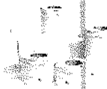
Fig. 1. Manga tipo tyvek con indicador químico para esterilización por plasma peróxido de hidrógeno 50% - 50% (no incluye diseño)