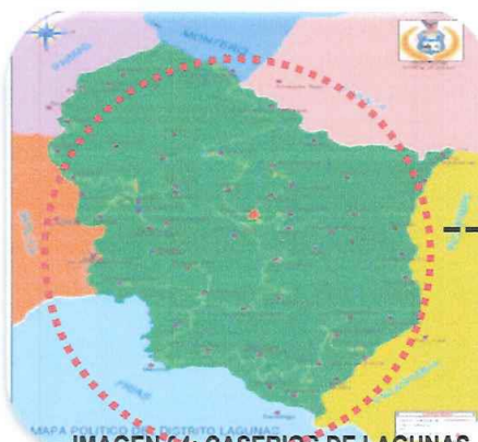
IMAGEN 04: CASERIOS DE LAGUNAS