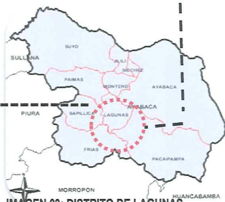
IMAGEN 03: DISTRITO DE LAGUNAS