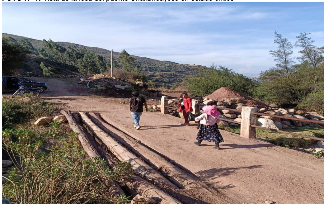
Fotografía N° 02 Vista del puente que presenta signos visibles de deterioro