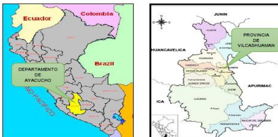
Mapa N° 1: Ubicación y Localización.

Región : Ayacucho Provincia : Vilcas Huamán Distritos : Concepción Localidad : Centro poblado de Virgen del Carmen de Pacamarca