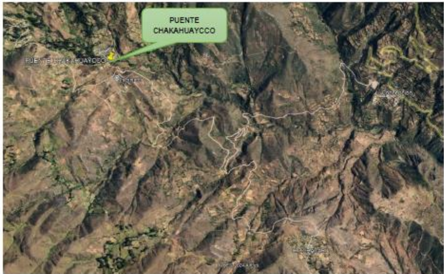
Figura N° 1: Imagen Satelital del Proyecto.

A continuación, se presentará una imagen Satelital del Proyecto: