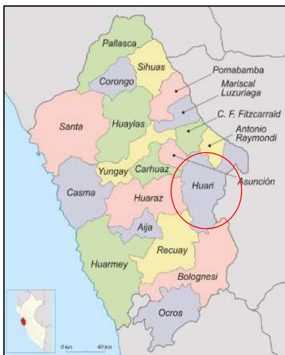
Ubicación de la Provincia de Huarí