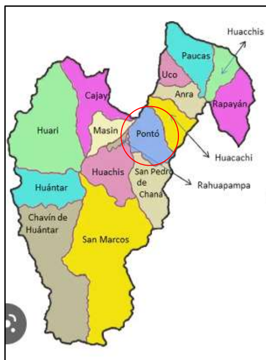
Ubicación del distrito de Pontó