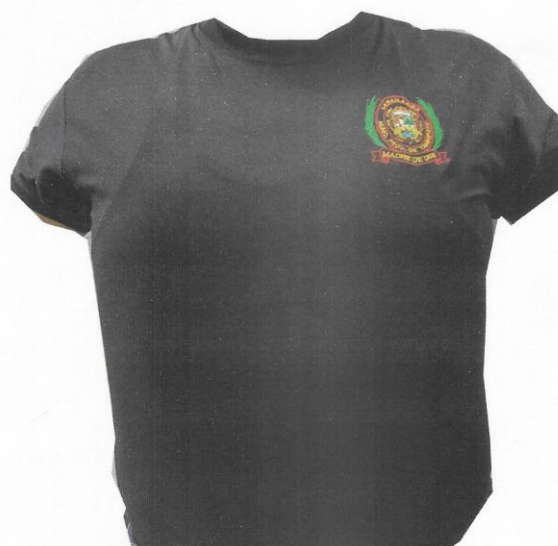
POLO DE TELA DRY MANGA CORTA