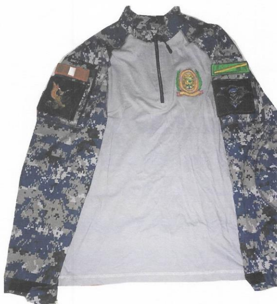
POLO DE TELA DRY MODELO TACTICO