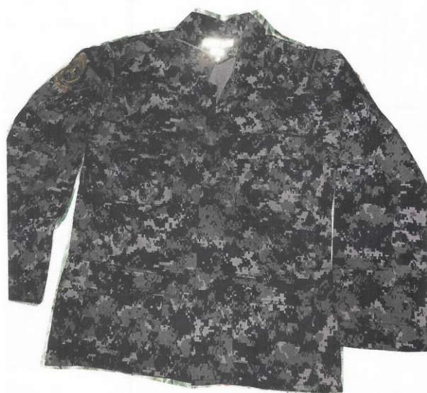
POLACA O CAMISA TACTICA