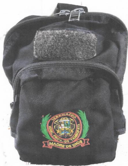
CANGURO O MUSLERA TACTICA