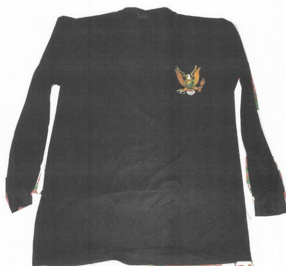
POLO DE TELA DRY MANGA LARGA