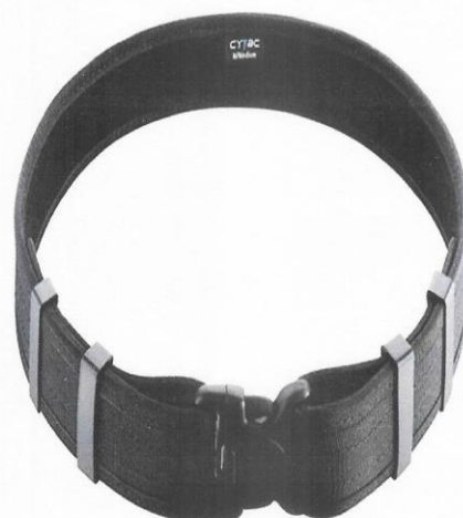
CORREAJE DE LONA