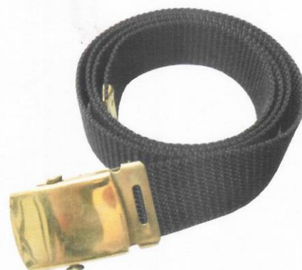
CORREA DE LONA