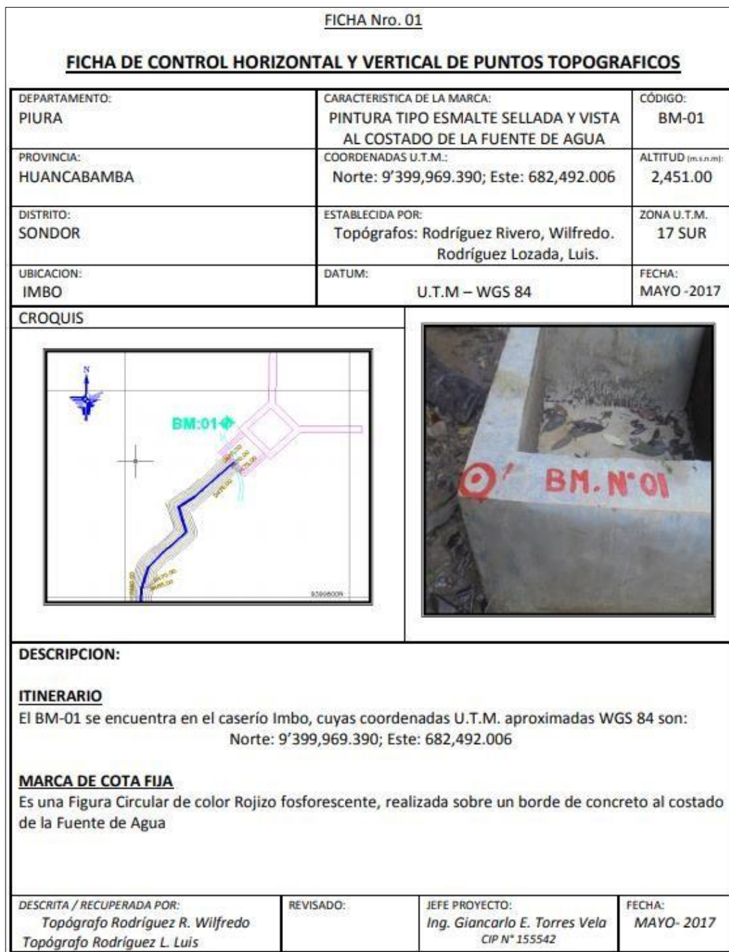
Imagen N° 01: Ejemplo Ficha BM Auxiliar:

Además, deberá presentar una ficha de formato similar por cada uno de los BMs (referencial o auxiliar) del proyecto. Estas fichas serán complementadas con fotos de cada BM, donde se aprecie el entorno.