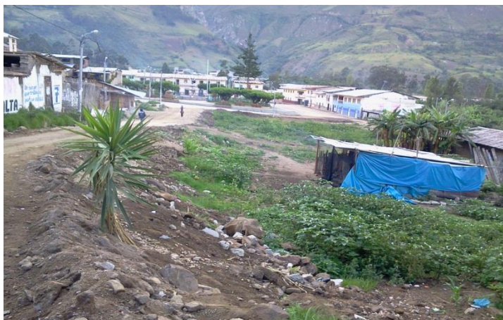
Fotografía 2 Vista de la Calle Principal de Sónor afectada por la reptación de suelos.

Tal como se muestra en la Fotografía anterior, se ha podido determinar que parte de la ciudad sufre de un fenómeno llamado reptación de suelos, que es un movimiento muy lento que se da en capas superiores de laderas arcillosas, Está relacionado con procesos de variación de humedad estacionales en el suelo, ya que el agua favorece este fenómeno actuando como lubricante además del aumento del peso consiguiente. A menudo la reptación no es el único proceso que ocasiona la inestabilidad de las pendientes. Este problema ha ocasionado que varias casas colapsen.