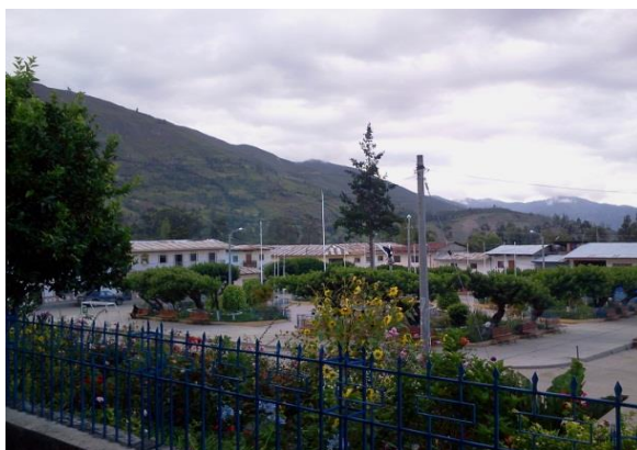
Fotografía 3 Vista de la Plaza de Armas de Sónдор.