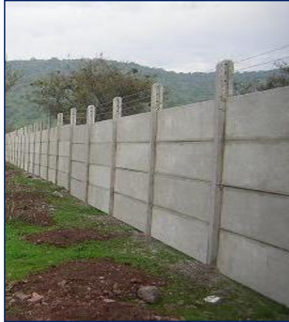
Fotografía 48. Vista de modelo para la construcción del cerco perimétrico proyectado que se instalara en la planta de tratamiento de aguas residuales.