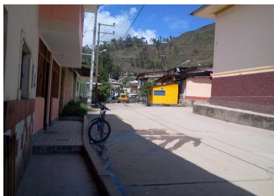
Fotografía 4 Vista de La Calle Progreso del Pueblo de Sónдор.