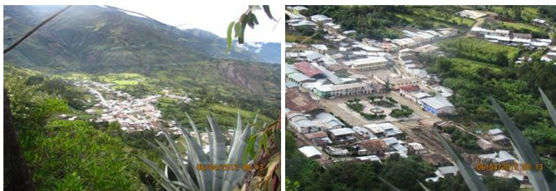
Fotografía 1. Se observa una vista completa del distrito de Sándor y otra vista la plaza de Sándor.

La capital del distrito es la ciudad de Sándor, situada a una altura de 2050 msnm. La ciudad está situada entre el Cerro Pashirca y el Cerro La Viuda; a la margen derecha de la quebrada de Sándor.