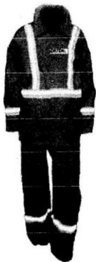
Uniforme de Mantenimiento