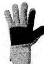
Guantes de Seguridad de Obra