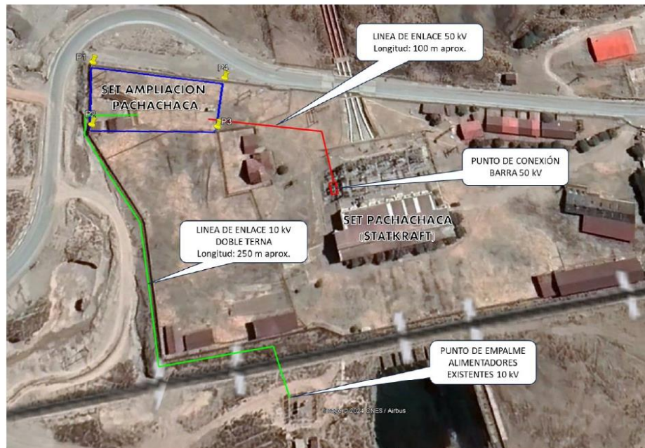
Figura 1. Componentes del proyecto

Adjudicación Simplificada N°009-2024–Electrocentro S.A. – Tercera Convocatoria