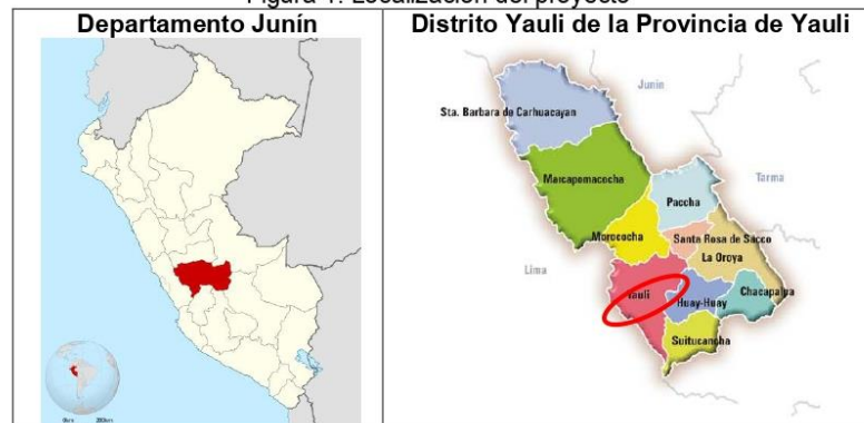
Figura 1: Localización del proyecto

Vías de acceso : El acceso a la zona del proyecto se realiza por: