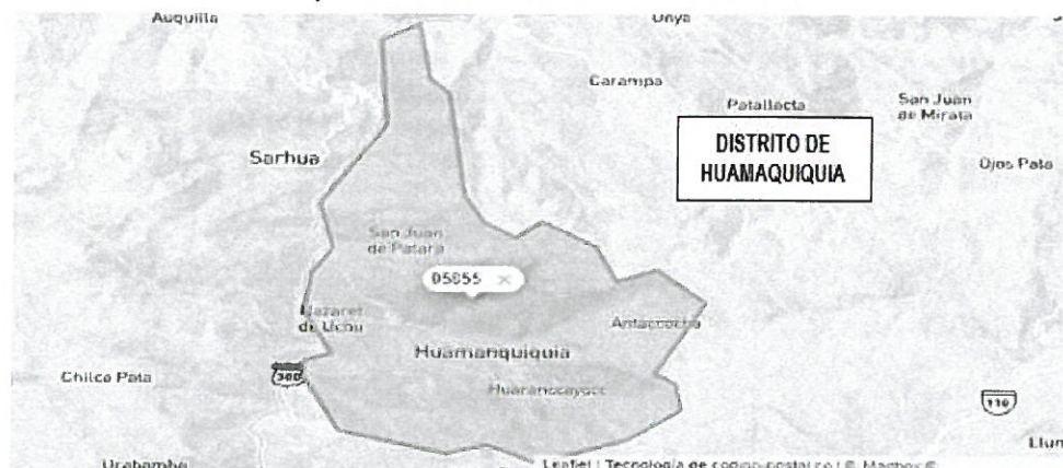
Mapa N°2: Micro Localización del PIP

Creado el 02 de junio de 1936 – Ley N° 8298