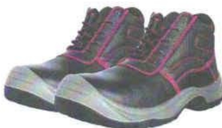
ZAPATOS DE SEGURIDAD TRABAJO – SEGURIDAD