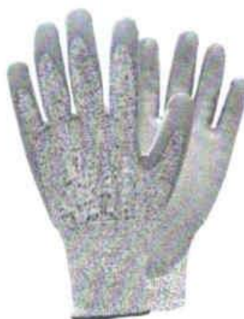
GUANTES DE TRABAJO

INSTITUTO DE VIALIDAD MUNICIPAL DE LA PROVINCIA DE CAJABAMBA